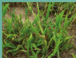
Anguina Déformations foliaires