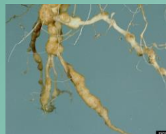
Meloidogyne Galles sur les racines