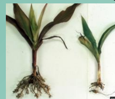
Belonolaimus Destruction des racines